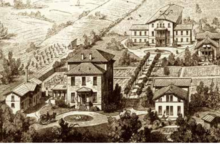
Der Bauplan für die St. Anshargemeinde