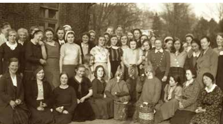
Ostern im ehemaligen Mädchenheim um 1920