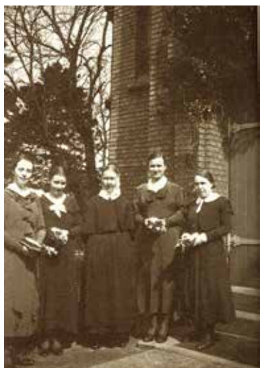
Unsere Kirche früher, Konfirmation um 1912