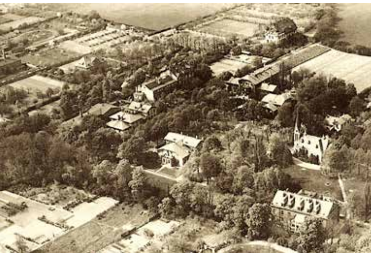
So sah es um 1930 auf der Ansharhöhe aus