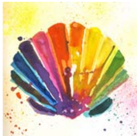
Grafiken: Pfeffer